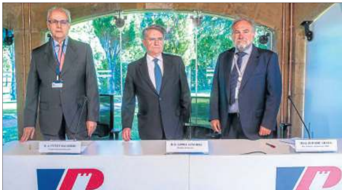
Los máximos ejecutivos de Petronor, ayer en el castillo de Muñatones.

Elecnor ha contratado bajo la modalidad "llave en mano" la primera fase del proyecto Bungala Solar (Bungala One), situado al norte de Port Augusta, en el estado de South Australia. La planta, que tendrá más de 437.000 paneles solares instalados en una superficie de alrededor de 250 hectáreas, producirá energía suficiente para abastecer a 39.000 hogares y evitará la emisión de 198.000 toneladas de CO 2 al año. La instalación estará operativa en el tercer trimestre del próximo año.