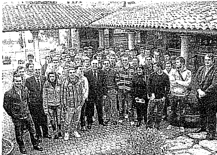
Foto de familia de la entrega de la primera parte de la beca a los 50 alumnos de FP.

El importe de las becas concedidas para este curso 2012-2013 es de 800 euros para los 7 alumnos de ciclos formativos de Grado Medio y de 1.000 euros para los 43 estudiantes de Grado Superior en las especialidades demandadas por la actividad de la empresa muskiztarra. Además, los dos mejores alumnos de cada uno de los ciclos recibirán un bonus adicional en reconocimiento a su esfuerzo.