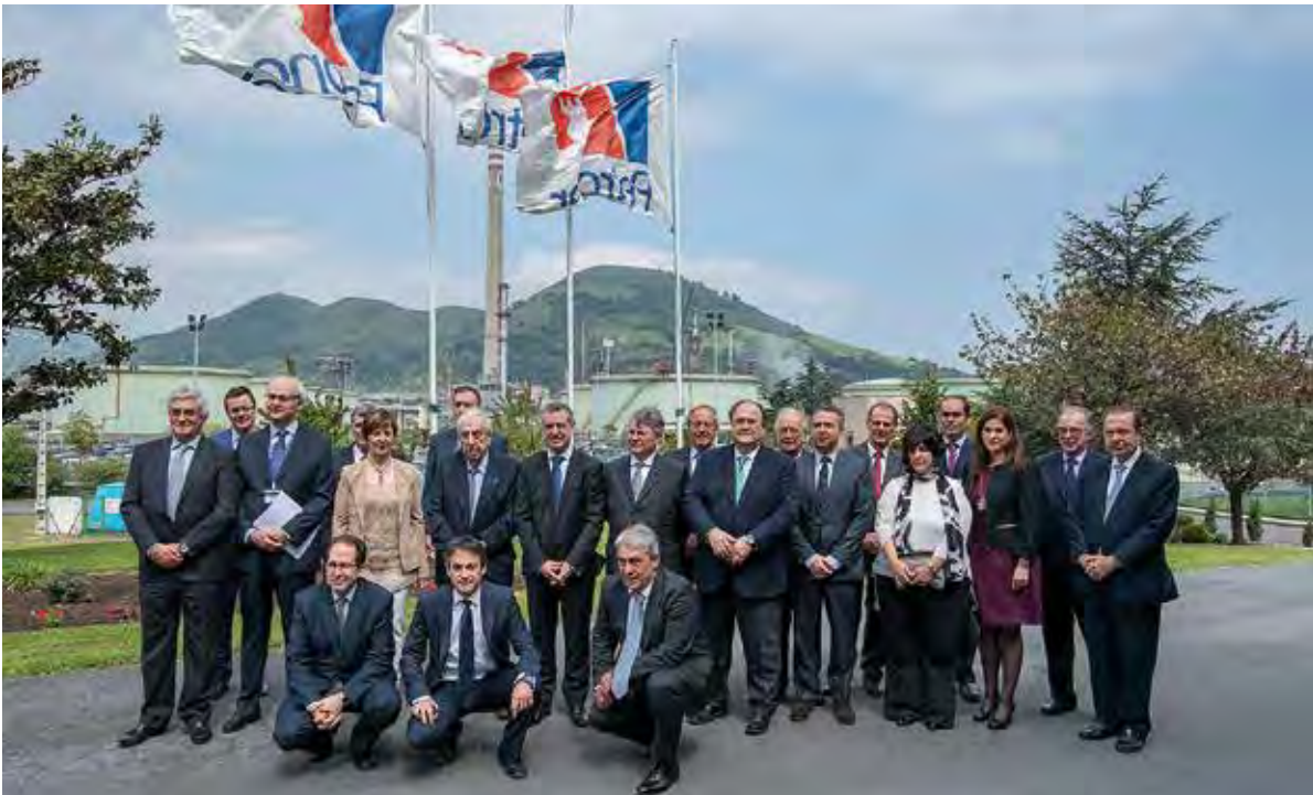
El lehendakari Iñigo Urkullu, con los alcaldes de Abanto, Muskiz y Zierbena y otras autoridades, junto con miembros del Consejo de Administración y directivos de Petronor.

Los centros tecnológicos Gaiker e Ikerlan, del grupo IK4 Research Alliance, y el Centro de Física de Materiales, de la Universidad del País Vasco y CSIC, han resultado ser los tres agentes científico-tecnológicos de la Red Vasca de Ciencia y Tecnología e Innovación, cuyos proyectos han sido finalmente seleccionados para dar respuesta a los retos planteados por el programa de innovación abierta INSPIRE de Petronor.