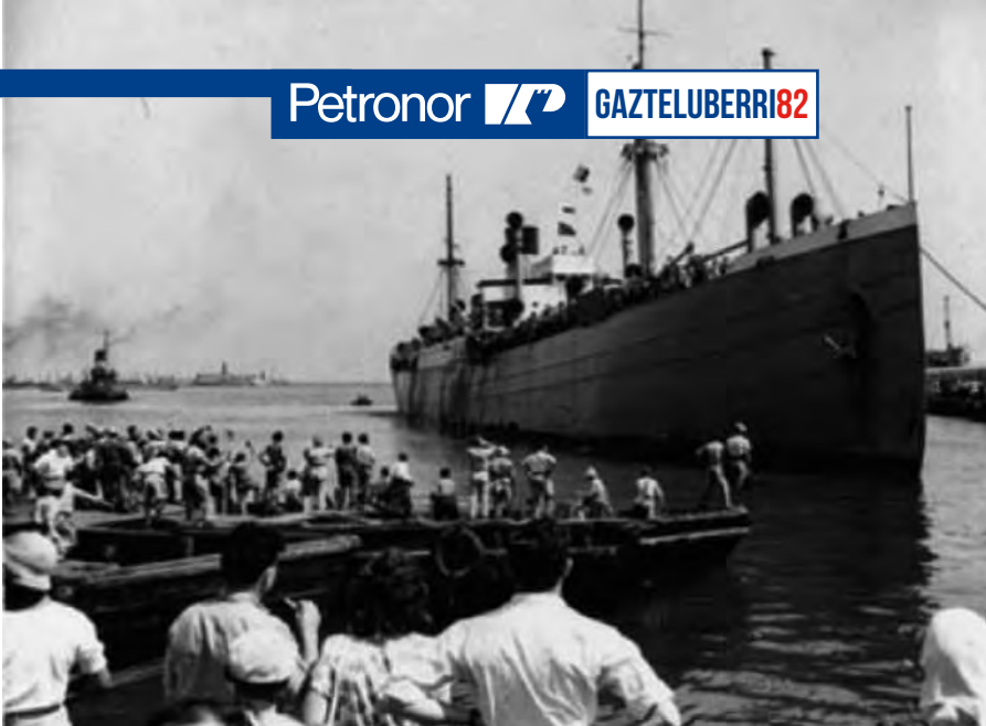
El buque Pan York entrando en Haifa, 9 de julio de 1948.