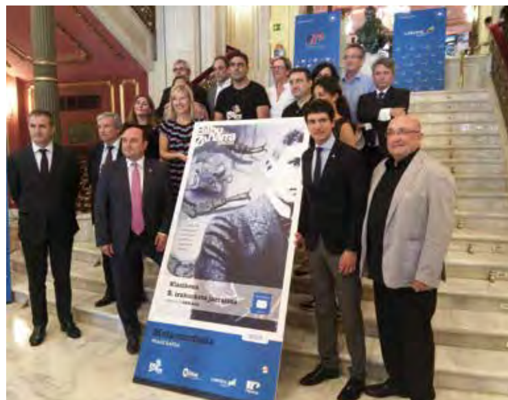
Representantes institucionales apoyaron la lectura de Kafka.

Coincidiendo con el centenario de la publicación de “La Metamorfosis”, el euskaltegi Bilbo Zaharra optó por la lectura de esta celeberrima obra de Franz Kafka.