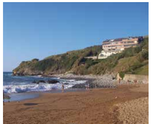
La Playa de La Arena antes (1967) y ahora.