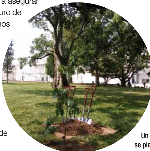
Un retoño del Gernikako Arbola se plantó junto al Congreso.