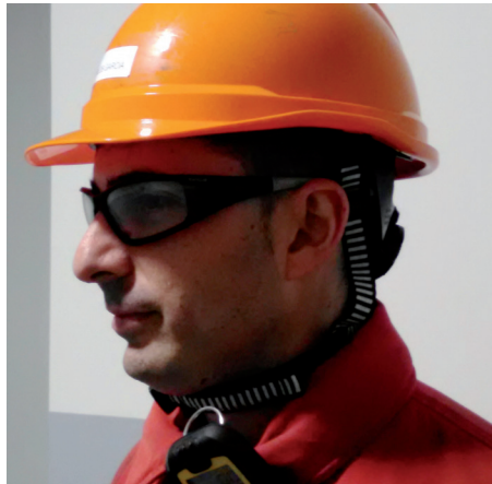
Coordinador de Seguridad con el barboquejo.

Durante esta Parada, se ha hecho extensiva la obligatoriedad del uso del barboquejo en todo momento y en todas las áreas del Complejo Industrial. Además, siempre que se abandone la cota cero deberá llevarse atado.