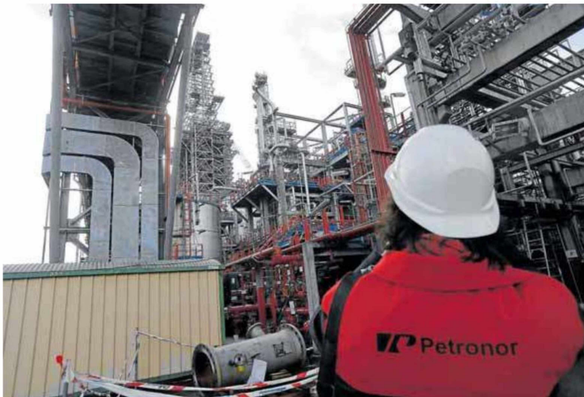
La refinera vizcaina trabajó en 2018 al máximo de la capacidad de sus instalaciones y procesó 78,7 millones de barriles de crudo.

Luque insistió en que 2018 fue “un buen año” después de unos ejercicios precedentes “difíciles en el sector de refino” y resaltó la importancia de que la compañía haya alcanzado su récord histórico de ventas coincidiendo con el 50 aniversario de la creación de la sociedad. Pese a la buena marcha de