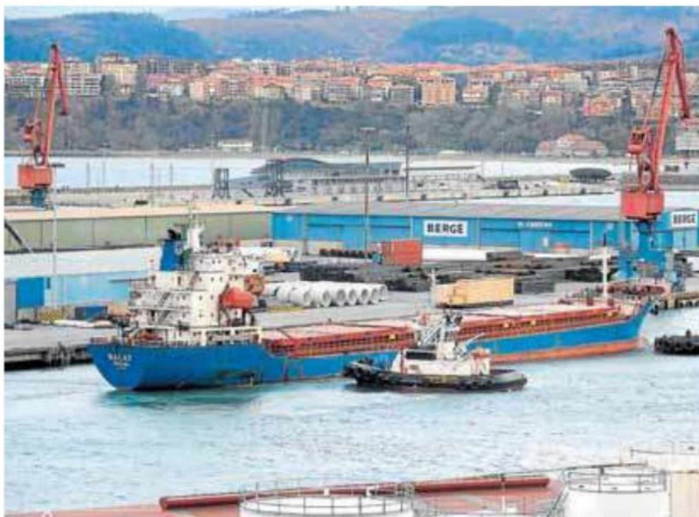
El Puerto de Bilbao se beneficia en su tráfico del auge exportador vasco.

López Atxurra recordó en referencia a los cambios que se avecinan en la movilidad que Petronor evoluciona en su negocio tradicional y trabaja en nuevos modelos de negocios "sin olvidarse de que hay que comer todos los días y tributar todos los días", lo que les obliga a que en su actividad propia sean "excelentes". Dentro de esa apuesta por la diversificación, además de las electrolineras, en la empresa se trabaja en proyectos de generación distribuida, "un vector de negocio en el que confío mucho", pero que irá de la mano de la introducción de "tecnología continuamente", algo que Petronor hace "por propia necesidad" y que es lo que garantiza "buenos resultados". "La innovación va a estar en la columna vertebral de nuestras actuaciones", concluyó. ●