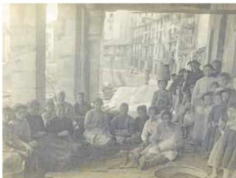
'Componiendo las redes', realizada en Bermeo.

amigos que les visitan. Se muestra también el panorama que se contempla desde la casa de los Zubiaurre, fundamentalmente la crestería de Durangaldea. También está incluida Tierra cuarta parte , con escenas de diferentes lugares de Madrid, así como una comida campestre.