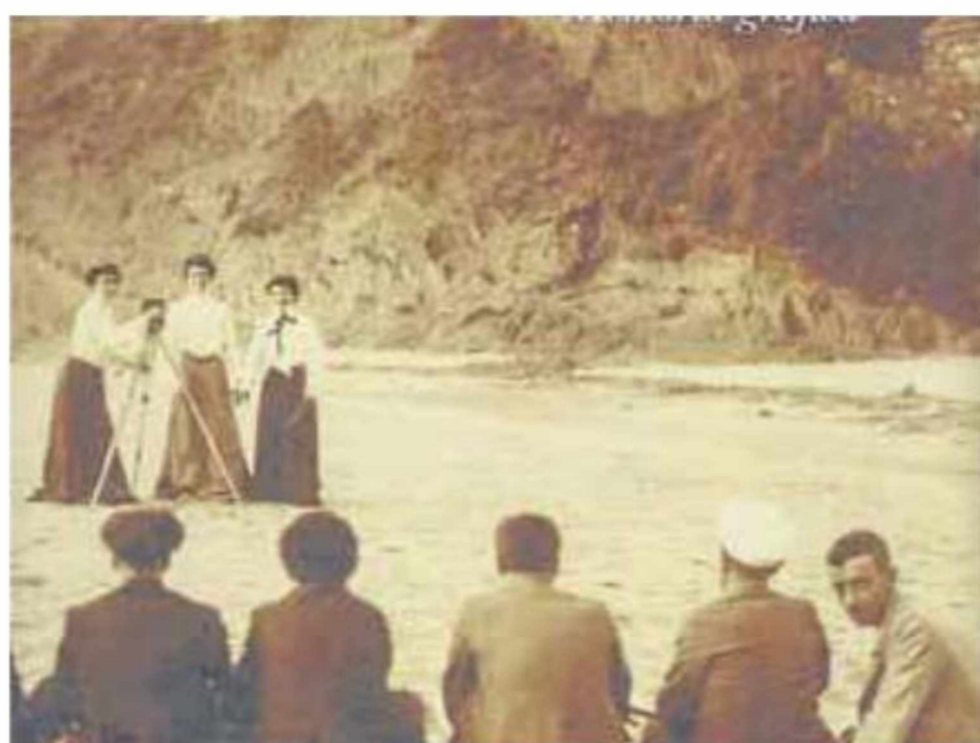
Fotografía de un álbum familiar.