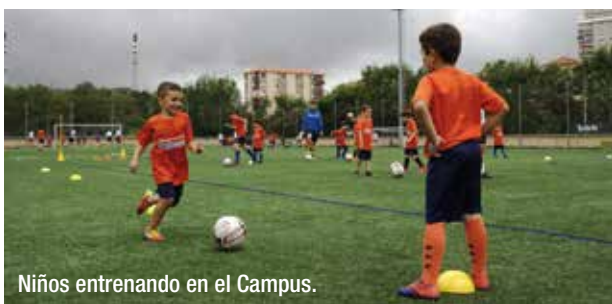
Niños entrenando en el Campus.

Como siempre, el Campus se dividió en dos tandas. La primera, que se desarrolló del 24 al 28 de junio, en horario de mañana, en el campo de El Mortuero (Las Carreras), contó con la participación de 53 pequeños. La segunda tanda fue en horario de mañana y tarde, del 1 al 12 de julio, en las instalaciones de El Malecón (Muskiz), y fueron 84 los txikis que lo disfrutaron.